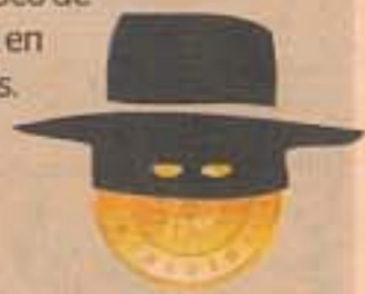
Cotización de bitcoin en euros en el último mes (3/11 al 3/12 de 2013)

- Anónima: las operaciones realizadas en bitcoins están a la vista de todo el mundo, no así la identidad del comprador y el vendedor, convirtiéndolas, con un poco de esfuerzo, en anónimas.